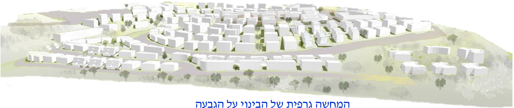
המחשה גרפית של הבינוי על הגבעה